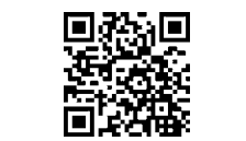
希望番号・図柄ナンバープレート申込サービスはこちらから。