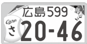
事業用には黄色の縁取りが施されます。