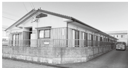
グループホームさくら (南栄2-6-31)

災害時に高齢者や障害のある方など、避難場所での生活で特別な配慮が必要な方が避難できる福祉避難所として『グループホームさくら』を指定しました。 令和7年12月22日に、「災害時における福祉避難所の設置運営に関する協定」を締結しました。