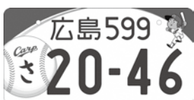
【登録自動車（自家用）】

※登録自動車とは、軽自動車や小型特殊自動車、二輪の小型自動車を除く自動車 ※フルカラーを希望する場合は、交付手数料などに加え、1000円以上の寄付が必要です。寄付金は、導入地域の交通改善や交通事故対策などに活用されます。