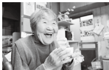
『104歳、哲代さんのひとり暮らし』製作委員会。