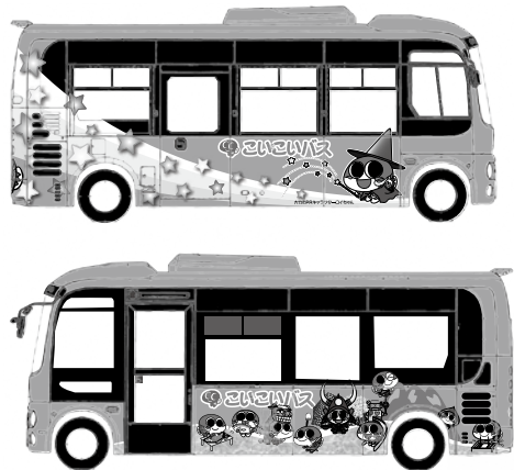
デザインはイメージであり、実際のものとは異なる場合があります。

令和6年2月に起きた事故をきっかけに、安全装置を装備しています。加えて次の装置を備え付けます。 ○運転手が急病などで運転が困難になった際、乗客が非常ブレーキスイッチを押すことで、車両を安全に停止させるドライバー異常時対応システム（押しボタン式） ○ニュートラルでハンドブレーキをせずにシートベルトをはずすと警告音が鳴る離席警報装置 ○設定速度超過を警告音で知らせるデジタルタコメーター ○衝突防止補助システム（従来のものよりも、夜間の歩行者認識が向上した後継機種）