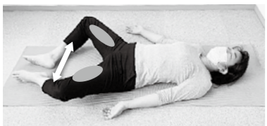
②両膝を開く、閉じる動作を5～10回程度ゆっくり繰り返す。