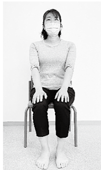
①軽く背筋を伸ばして椅子に浅く座る。手を軽く膝にのせる。