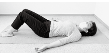
①あおむけになり、両膝を立てる。