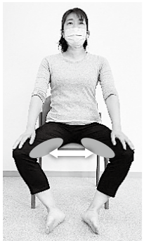
②両膝を開く、閉じる動作を5～10回程度ゆっくり繰り返す。