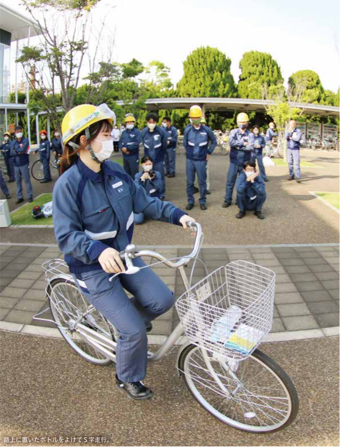
路上に置いたボトルをよけてS字走行。