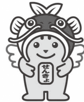
明るい選挙キャラクター 選挙のめいすいくん (広島県ご当地めいすいくん)