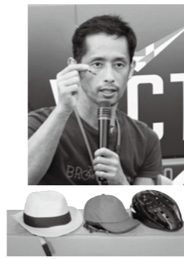
帽子のように見えるヘルメットも内部は衝撃を和らげる構造になっています。

法改正を機に、年配の女性からの注文が多いです。一見ヘルメットに見えないようなタイプのものもあります。購入するときは、実際にかぶってみて、安全品質が保証された「SG」や「JCF」などのマークが付いているものをお勧めします。それと夜間の無灯火は危険なのでやめて欲しいですね。車を運転する人は分かると思いますが、無灯火は車から自転車の姿を認識することが難しいです。