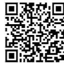
YouTube大竹市図書館チャンネル