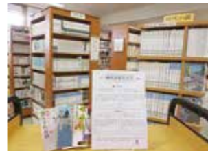
「時代小説だより」ができました。ご自由にお取りください。