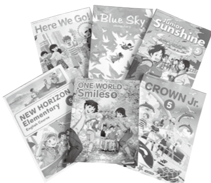
写真以外の新しくなる教科書も展示しています。

令和6年度から全国の小学校で使用する教科書が新しくなります。児童たちが新しく使う教科書を市民の皆さんにも知ってもらうため、見本を展示し、意見を募集します。新しく使用する教科書は、この見本の中から8月に決定する予定です。 とき 6月14日(水)～27日(火) ところ 総合市民会館1階ロビー