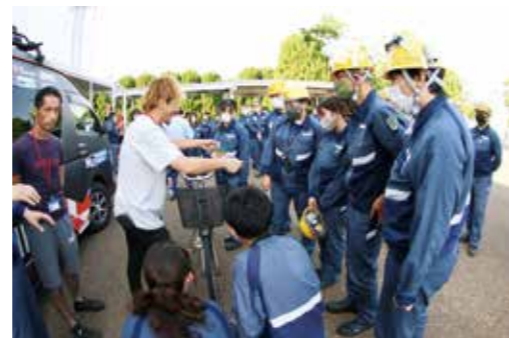
（上右）竹野さんの自転車の点検整備の説明に聞き入る従業員たち。（上左）路上に止まっている車のドアが急に開くこともあります。追い越すときには注意が必要。