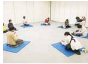
おひざにだっこのおはなし会の様子