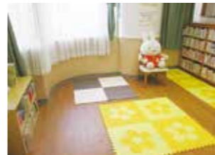
「おはなしのへや」かわいくなりました。