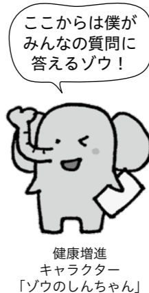
健康増進キャラクター「ゾウのしんちゃん」

元気にいきいきと生活するために、年1回の健康診断が大切です。「面倒くさい」「時間がない」「自分は健康だから大丈夫」と敬遠しがちですが、病気になるってから分かるのが健康の大切さです。自覚症状が出る前に健(検)診を受けましょう。