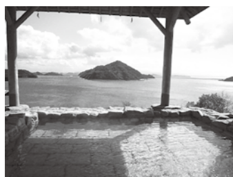
きのえ温泉ホテル清風館 露天風呂 (大崎上島町)

3月18日(土)8時20分～18時 集合・解散場所 広島駅新幹線口 参加料 8000円(交通費、屋食代込み) 定員 20人 ※最少催行人数15人、定員に達し次第募集終了 申し込み 2月15日(水)から 交観光株式会社(9時30分)