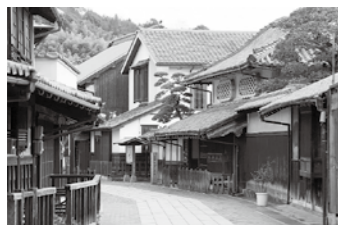
たけはら町並み保存地区 (竹原市)