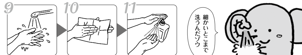
⑨洗剤を十分な流水でよく洗い流す ⑩手を拭き乾燥させる（タオルなどの共用はしないこと） ⑪アルコールによる消毒（爪下、爪周辺に直接かけた後、手指全体によく擦り込む）