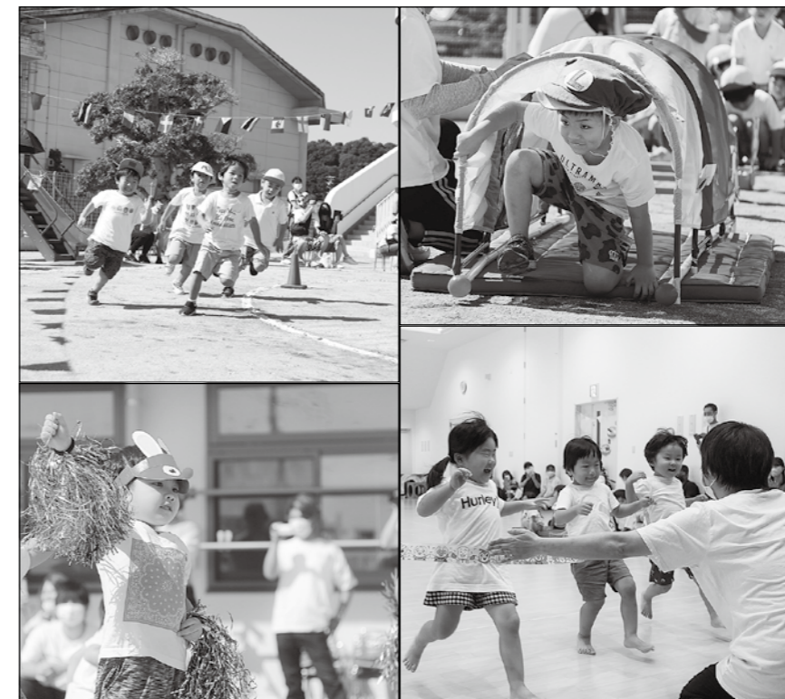
今年度の小方認定こども園運動会

〔入所(園)基準〕 保護者が次のいずれかに該当し、保育を必要とする場合 ①仕事をしている場合(月48時間以上) ②母親が出産の場合(出産予定日の8週間前の属する月の初日から出産後8週間を迎えた日の属する月の末日まで) ③病気または障害がある場合 ④同居親族の介護・看護を常時している場合 ⑤震災、風水害、火災などその他の災害の復旧にあたる場合 ⑥求職活動を継続的に行っている場合(最大90日間) ⑦就学、職業訓練をしている場合 ⑧育児休業取得の場合(令和5年4月1日現在で満3歳以上の児童に限る) ※小方認定こども園の教育認定で申し込みをする場合は、この入所(園)基準に該当する必要があるありません。 【申し込み】 令和5年4月中旬に新たに入所(園)を希望する方 詳細は「受付期間」の表をご覧ください。 ※第2次申し込みは第1次申し込み、第3次申し込みは第