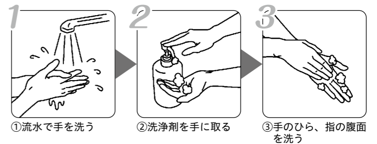
①流水で手を洗う ②洗剤を手取る ③手のひら、指の腹面を洗う