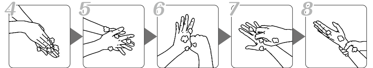
④手の甲、指の背を洗う ⑤指の間（側面）、股（付け根）を洗う ⑥親指・親指の付け根のふくらみを洗う ⑦指先を洗う ⑧手首を洗う