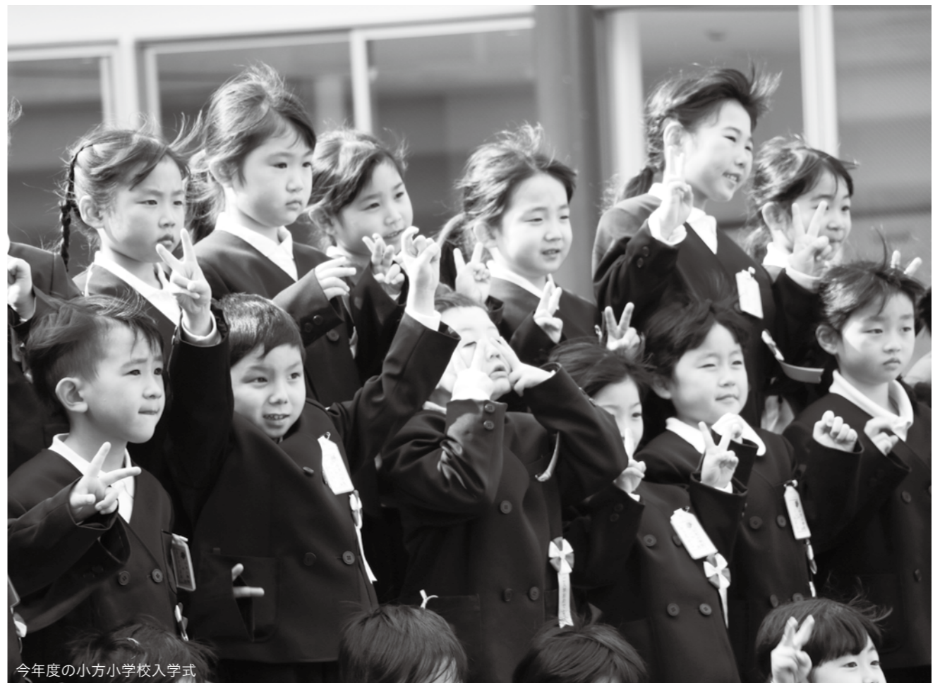
今年度の小方小学校入学式