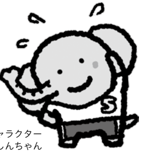
健康増進キャラクター ゾウのしんちゃん