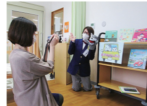
YouTube撮影風景。チャンネル登録をお願いします。