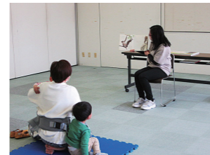
土曜日の「おはなし会」の様子