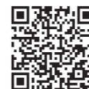
YouTube大竹市 図書館チャンネル