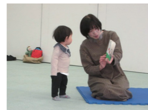
「親子で楽しむおはなし会」の様子