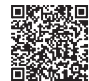
広島がんネット アプリアランスケア

対象 次の要件を全て満たす方 ①申請時に広島県内に住所がある ②がんの治療を受けたこと、または現在受けている ③がんの治療により脱毛が生じた、または生じる恐れがあり、その脱毛による外見の変化を補完するために購入したものである 申請時期 購入日から1年以内 詳しくは、県健康福祉局健康づくり推進課がん医療・共生グループ(☎082-513-3093)へ問い合わせください。 ※県のがん情報サポートサイト「広島がんネット」アプリアランスケアウィッグ購入費助成」で検索。関係様式などを掲載しています。QRコードからも検索できます。