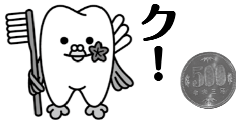
広島県歯科医師会 オリジナルイメージキャラクター はっぼくん