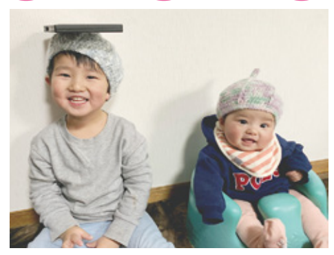
これからもお兄ちゃんと遊ぶのが楽しみね★