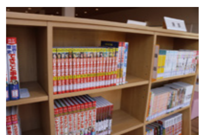
図書コーナーには、小説、エッセイ、実用書、絵本、学習まんがなど1500冊以上の本があり、貸し出しもできます。

おわびと訂正 2月号12ページに掲載した大竹会館「アゼリアおおたけ」の1階の部屋の定員に誤りがありました。おわびして訂正します。 ○RoomC 定員 (正) 18人 (誤) 6人