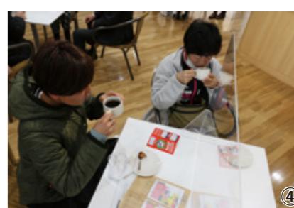
①床や天井に木材を使用。落ち着ける施設となっています。②FREE Wi-Fiでインターネット環境も充実。③入館時には非接触式の検温器で体温のチェック。④市民スペースでは、食事や喫茶も楽しめます。