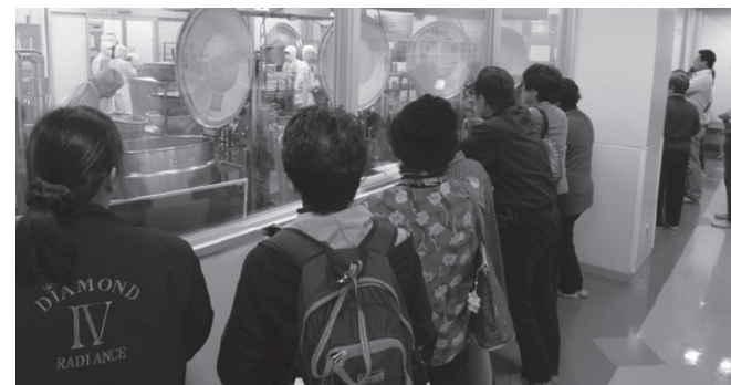
もりもりたべるくん