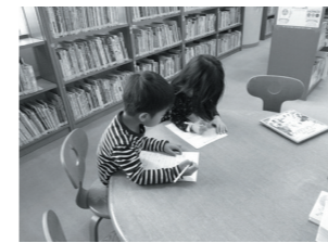
「としよかんクイズ」に挑戦

市内の各種団体名の「大竹市」「大竹」などは、原則省略しています。 Ray-wa information station