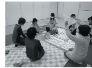
4月のおひざにだっこのおはなし会