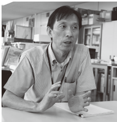
60周年記念事業への思いを熱く語る香川課長。

当日は、販売以外にもオークションを行うなど工夫を凝らし、場を盛り上げていきますので、皆さん、ぜひご来場ください。