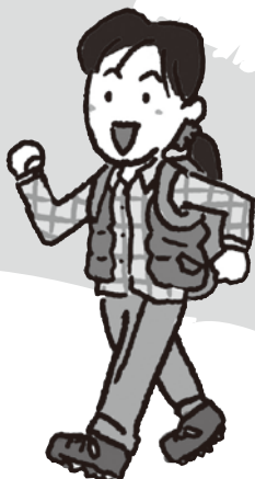
さつきちゃん 大竹の名所や名物に詳しい 小学5年生の女の子。 たけし君の頼れるお姉ちゃん。