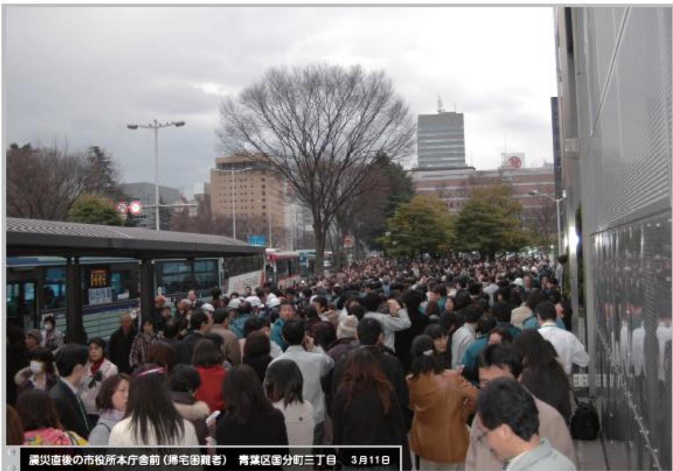
震災直後の市役所本庁舎前（帰宅困難者） 青葉区国分町三丁目 3月11日