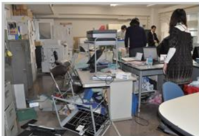
地震発生直後の市役所執務室 青葉区国分町三丁目 3月11日