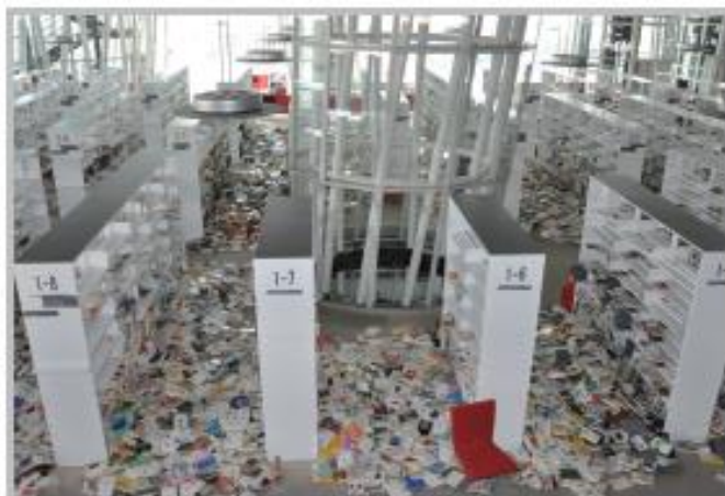
せんだいメディアテーク3階市民図書館 青葉区 3月12日