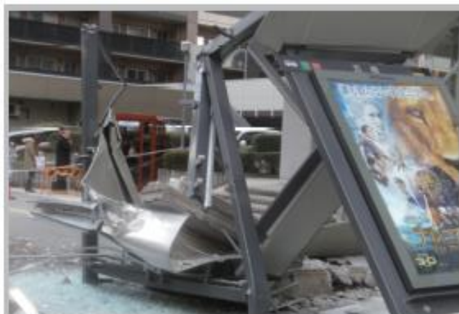
バス停がビル外壁の落下により破壊 青葉区五楼一丁目 3月12日