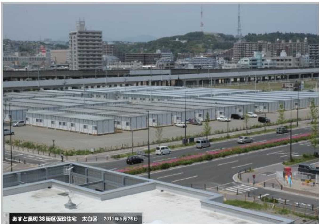
あすと長町38街区仮設住宅 太白区 2011年5月26日