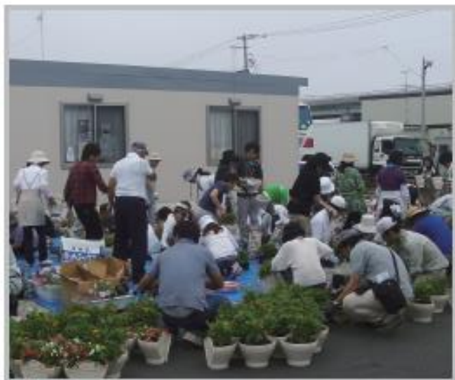
仙台港背後地6号公園仮設住宅で行われた緑化イベント 宮城野区中野 2011年8月4日