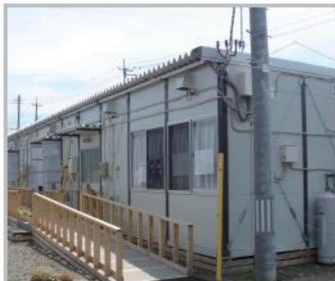
港南西公園仮設住宅 宮城野区蒲生 2011年7月14日