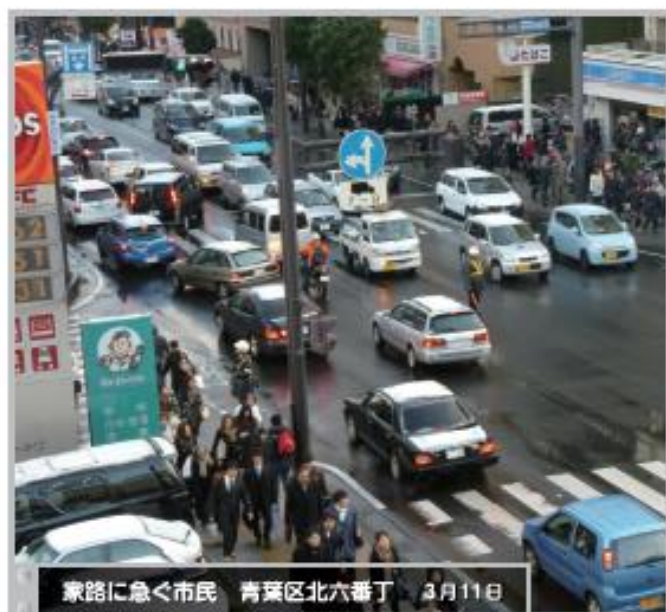
家路に急ぐ市民 青葉区北六番丁 3月11日