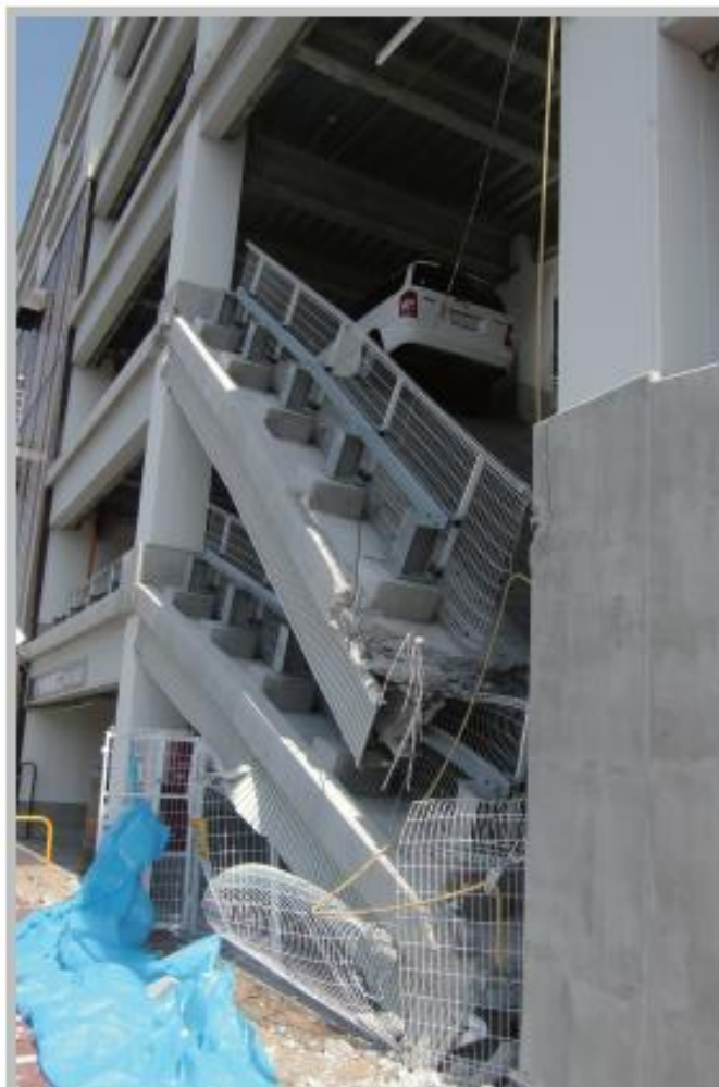
ショッピングセンターの駐車場車路が落下 太白区長町七丁目 3月14日