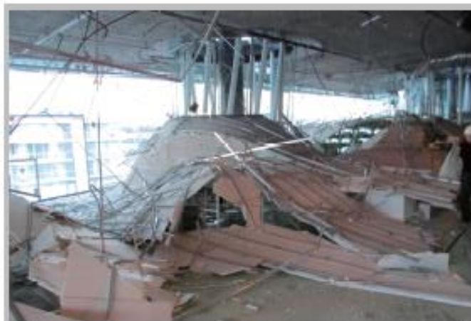
せんだいメディアテーク7階天井落下 青葉区 3月12日