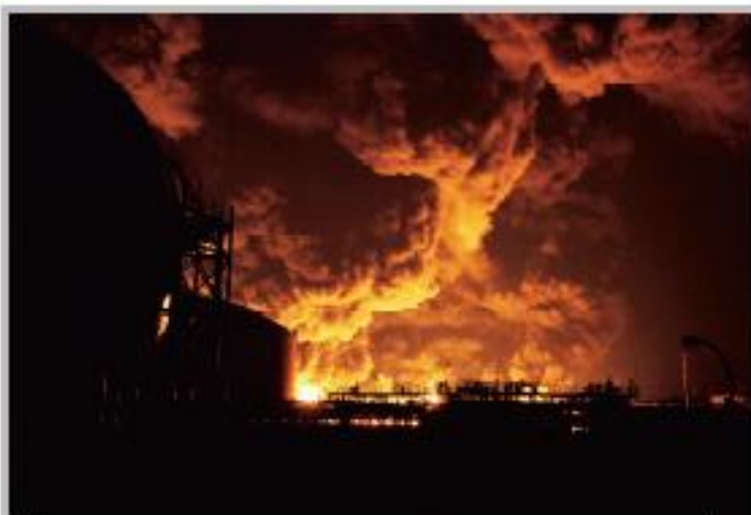
① 目前に迫る石油コンビナート火災 3月11日 21時51分