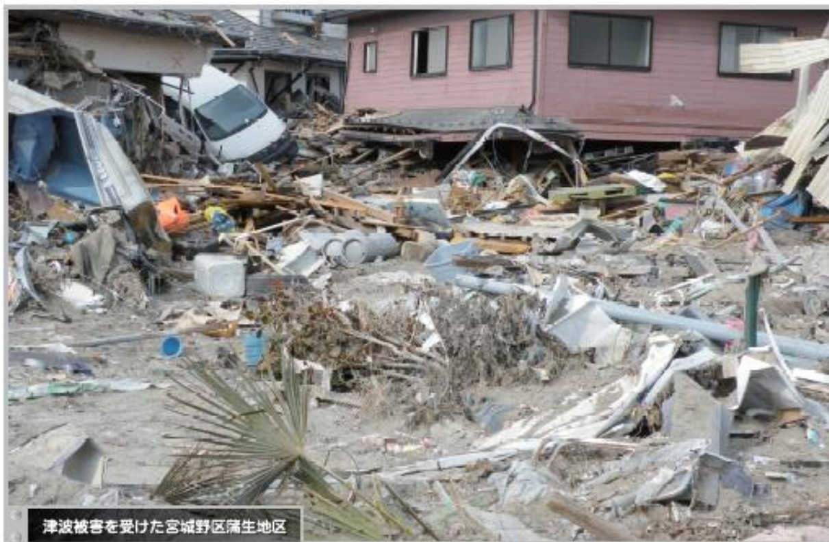
津波被害を受けた宮城野区蒲生地区