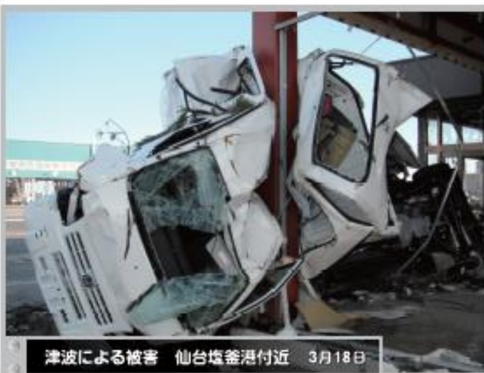
⑤ 津波による被害 仙台塩釜港付近 3月18日