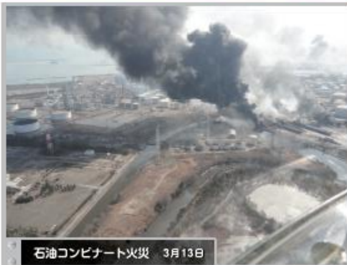
② 石油コンビナート火災 3月13日