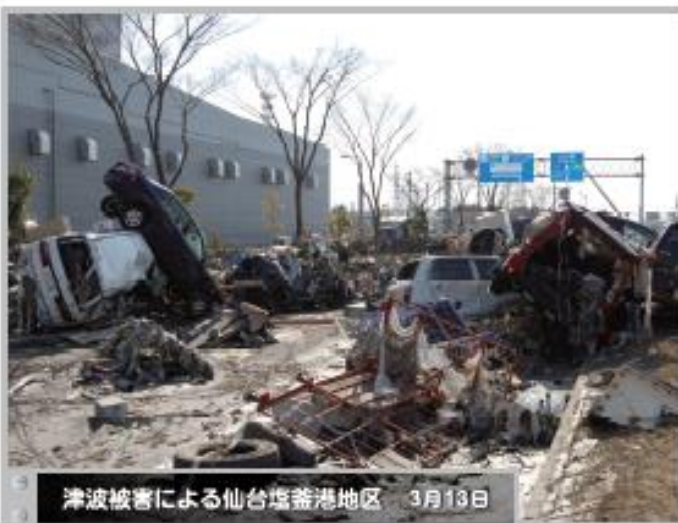
③ 津波被害による仙台塩釜港地区 3月13日