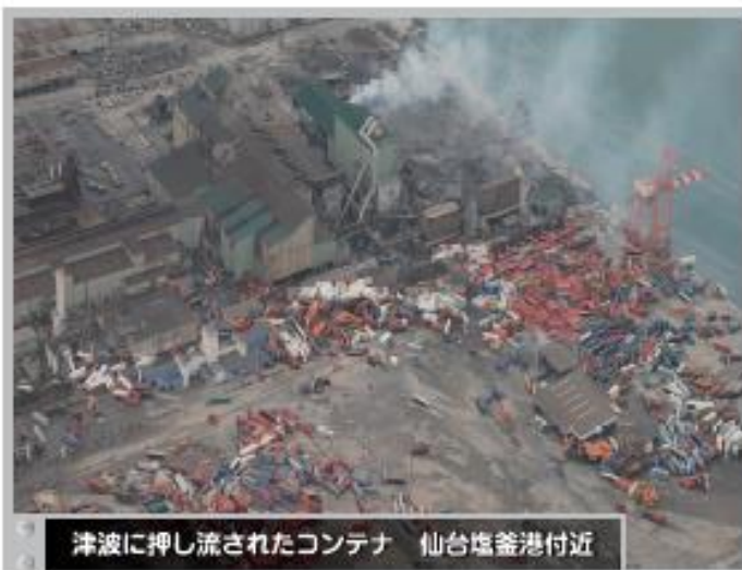
⑥ 津波に押し流されたコンテナ 仙台塩釜港付近