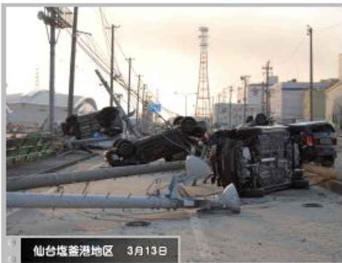
④ 仙台塩釜港地区 3月13日