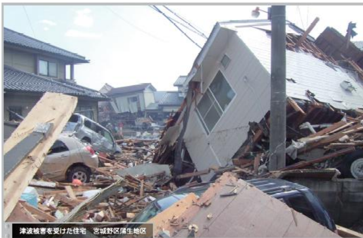
津波被害を受けた住宅 宮城野区蒲生地区