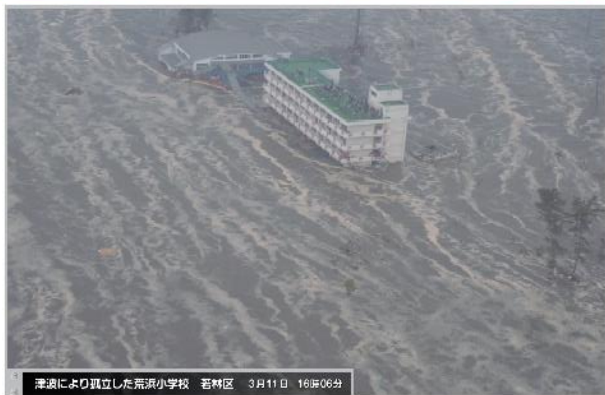
津波により孤立した荒浜小学校 若林区 3月11日 16時06分