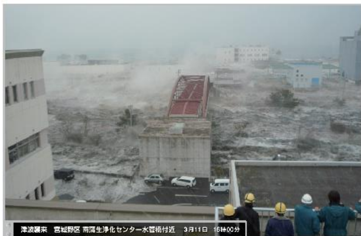
津波襲来 宮城野区 南蒲生浄化センター水管橋付近 3月11日 16時00分