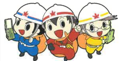
広島県防災キャラクター「タスケ三兄弟」