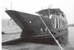
はるかぜ 新フェリー「悠風」

新船の建造には、建造費に加えて借入金の利子などが生じる。この度は、公設民営方式で建造のため欠損削減効果がある。それにより新船導入後の運賃上昇を当面見送ることが可能で、島民全体の支援につながると考える。