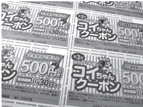
配布されたコイちゃんクーポン (使用期限は 11月30日まで)

Q 教育費の、学校給食費支援事業で、学校給食費の半額支援を実施する根拠と支援の期限について問う。