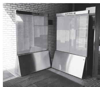
大竹市役所南玄関前の掲示板