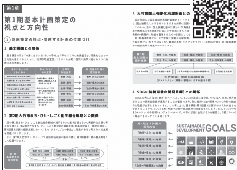
第1期大竹市まちづくり基本計画

答 個人の考え方などから、直接結婚につながる施策は行っていません。しかし、結婚は人と人とのつながりや交流から生まれます。市が出会いや交流を促すような施設の整備や取り組みを増やすことで、結婚の機会の増加にもつながると考えます。