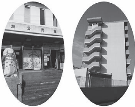
さかえ公民館と市営住宅6号棟

答 公民館などの清掃業務は、速さを求めているのではなく、清潔に保たれていることを条件としています。以前、委託先をシルバー人材センターへ変更したことで、委託料を約半額に抑えることができました。ただし、公金を使った委託料ですので、金額については今後研究を進めていきます。