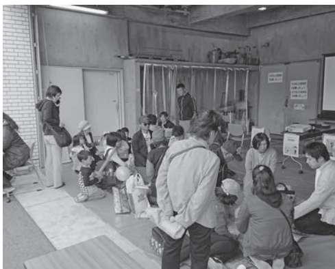
コロナ禍前 市民団体と協化したイベントブース

答 市は、各市民団体の状況に応じた活動継続への支援をしています。例えば、本年3月に自治会ハンドブックを作成し、自治会運営のノウハウの共有や継承の一助になればと各自治会に配付しました。教育委員会でも、文化協会や体育協会などに對し、担当職員が定期的に連絡を取り、活動をサポートすることで、活動が途絶えない取組をしています。 コロナ禍であっても、組織として、人事異動による影響を最小限にする仕組みが大切であり、職員が人事異動を通じて得た経験や能力を、将来にわたって、市民サービスの向上という形で還元していきたいと考えています。また、コロナ禍を踏まえた市民団体との新たな連携や協働のあり方についても考えていきます。