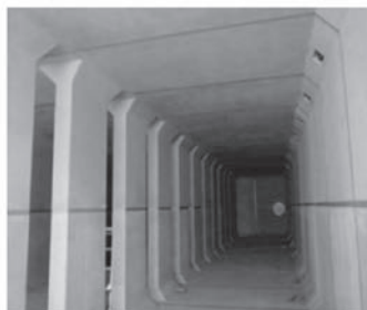
市街地に降った雨を一時的に貯留することにより、河川への流出を抑制し、内水浸水被害の防止・軽減を図る