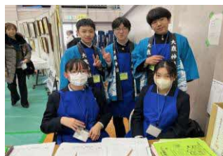
玖波中学生生徒案内係