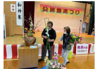
華道 いけこみ実演