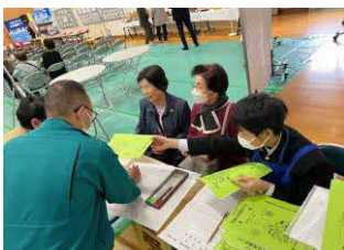
グループ生 受付係