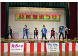
知恩保育園 園児演技