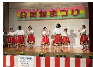
フォークダンス軽やかなステップ