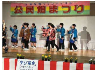
げんきいっぱいの初出演