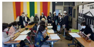
大正琴の演奏を見学

1月23日(金) 玖波小学校 6年生の皆さんが、地域学習の一環として「玖波の自慢」をテーマに玖波公民館を訪れました。研修室では公民館の役割や地域のイベントについて質問や意見交換を行い、ちょうど練習日だった大正琴グループの演奏も見学。世代を超えた交流に、会場は和やかな雰囲気になりました。