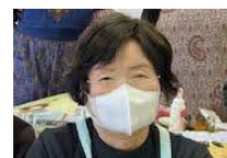
まつり実行委員長（展示）