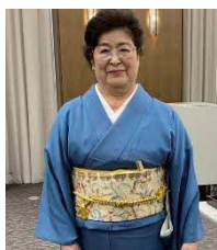
まつり実行委員長（発表）

昭和 49 年の設立から、長きにわたり地域の皆さんに愛されてきた玖波公民館。長い歴史に一つのピリオドを打ち、令和 9 年の春には新しい建物に生まれ変わる予定です。この建物での最後の『公民館まつり』を来月開催します。特別な『公民館まつり』です。良い思い出となりますように。