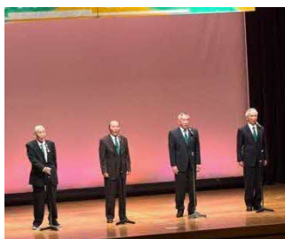
正心流竹山吟詩会