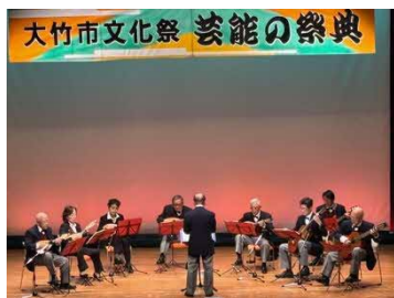
大竹マンドリンアンサンブル

その後、軽音楽、吟剣詩舞、民舞、歌謡、洋舞、民謡、大正琴、謡曲と多くのジャンルの32グループによる発表がありました。