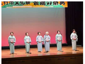
吟道鶴州流大竹教室