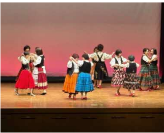
やさしいフォークダンス ひまわり会