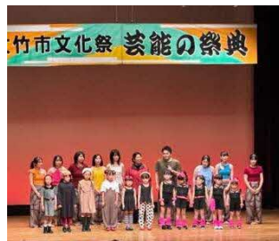
ダンスサークル ABEAT クラブ