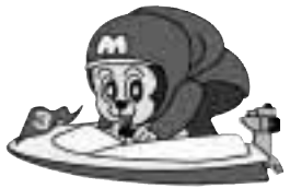
ボートレース宮島マスコットキャラクター「モンタ」