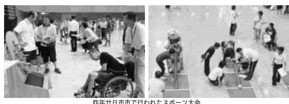
昨年廿日市市で行われたスポーツ大会

スローピ、グラウンドゴルフ、カローリング、ビンボウリング 持 参 品 運動のできる服装、屋内用運動靴、タオル 申 込 込 込 7月5日(木)までに社会福祉協議会へ。