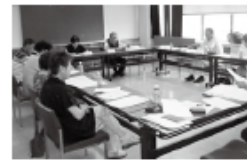
幹線交通検討分科会の様子

今後は、こいこいバスの利用者に対してアンケート調査を実施し、アンケート結果から案がら出てきた課題の改善策を検討していく予定です。反映できるものは反映させ、サービスの向上に努めます。