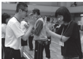
最後はみんなでフォークダンス。

スポーツを通して交流する「障害者ふれあいスポーツ大会」が開催された。たくさんの競技が行われ、多くの方が汗を流した。