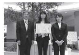
※社会福祉協議会会長(左) 宮島所属の角選手、向井田選手(右)

4月26日(水)、宮島競艇施行組合は、チャリティオークションの収益金102,500円を地域福祉へ役立てるため、社会福祉協議会へ寄付しました。