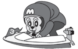
ボートレース宮島マスコットキャラクター「モンタ」