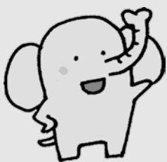
健康増進キャラクター ゾウのしんちゃん

市民の皆さん、健康に気をつけましょう。そして、「自分のため、家族のため」に健診（検診）を受けましょう。