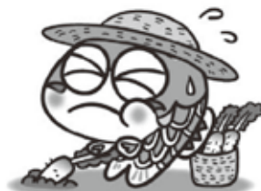
“おおたけ” PRキャラクター コイちゃん