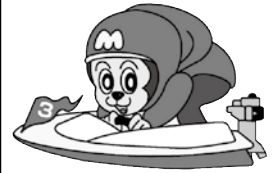
ボートレース宮島マスコット キャラクター「モンタ」