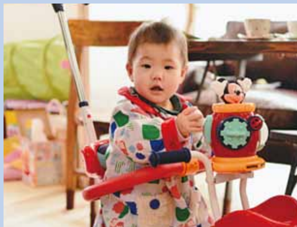
笑顔いっぱい女の子になってほしいな♡