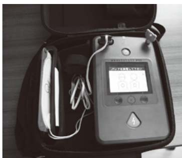
AED(自動体外式除細動器)

いざという時のための応急手当として、心肺蘇生法やAED(自動体外式除細動器)の使用法を習得する普通救命講習を開催します。 救急車が、到着するまでの応急処置こそが、大切な人の命を守ることに繋がります。この機会に、ぜひ受講してください。 とき 7月14日(日) 9時～12時 ところ 消防署 対象 市内在住または勤務の方