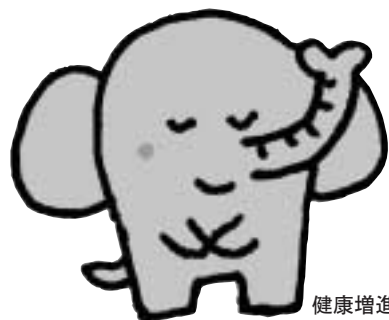
健康増進キャラクター ゾウのしんちゃん

詳しい内容は、受診券と 一緒に送る「平成28年度健診・ がん検診のしおり」をご覧ください。 この機会に健診に行かないのは 「もったいない」ゾウ！