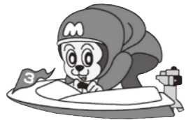
ボートレース宮島マスコットキャラクター「モンタ」