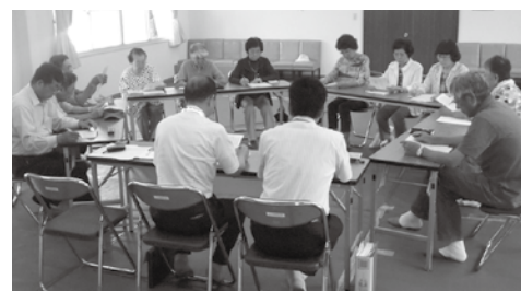
プロジェクト委員会の様子

ワーキング委員会24回、プロジェクト委員会6回、全体会議5回、合計35回もの議論を重ね、ワーキング委員会立ち上げから1年半を経て、実証運行が開始されました。