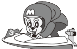
ボートレース宮島マスコットキャラクター「モンタ」