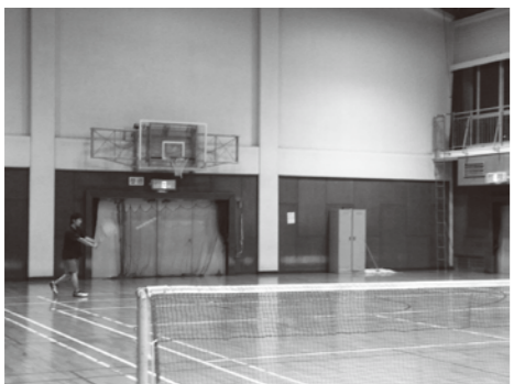
④お気軽にお立ち寄りください