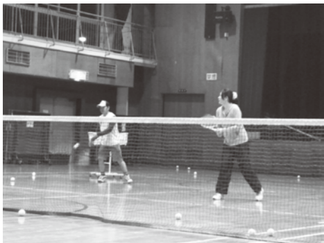
②コーチの指導もあるので未経験者でも大丈夫

毎週火・木、19時30分～21時30分まで小方公民館の体育館(ゆめタウン大竹の向かい側)で活動しています。室内なので天候に左右されずに定期的に体を動かすことができますよ。興味のある方、まずは生涯学習課までご連絡ください。