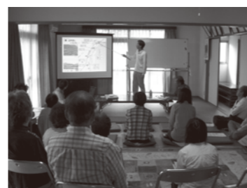
アンケート報告会の様子 (10月16日 玖波8丁目集会所)

■支線交通トピックス ○ひまわりタクシー(玖波7) 運行から4カ月が経過し、利用状況をふまえて検証を行いました。まだ、あまり利用者が多くないこともあり、制度の周知を進めるとともに、改善点を洗い出すため、改めてアンケートを実施することにしました。 ○玖波8丁目 8月に実施したアンケート結果をまとめ、10月16日に報告会を行いました。 当日は、日曜日にも関わらず25人の参加があり、「乗合タクシー」の利用方法や地元運営による支線交通の手法など、前向きな質問、意見が出されました。 また、11月2日には、住民委員による検討会を開きました。アンケート結果をふまえて、隣接する玖波7丁目の「ひまわりタクシー」との連携を前提に、運行内容について話し合いました。