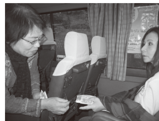
利用者(右)にグッズを配る 幹線交通検討分科会のメンバー

これまでの2年間は、利用者数も収支率も順調に増加しています。利用者数は目標値を達成しましたが、これを下回ることのないよう、引き続き、利用促進やサービスの向上に努めていきたいと考えています。 また、23年下半年期には、もう一つの目標である収支率50%をぜひ、実現したいと思っています。皆さまのご利用をお願いいたします。 ○10月26日は「バス記念日」 粗品をお配りしました。 こいこいバスの運行開始日である10月26日は「バス記念日」です。日ごろの利用への感謝の気持ちを込めて、当日乗車いただいた方一人一人にグッズ(ポケットティッシュと携帯用時刻表)をお配りしました。