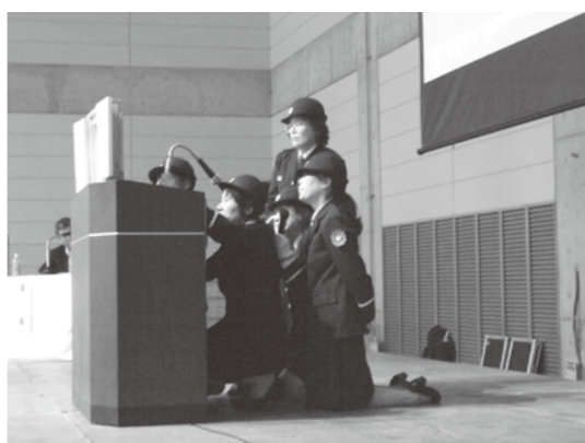
女性団員5人による防火紙芝居の発表

この防火紙芝居は、幼児を対象に、1年間を通して行い、幼い子供たちに火災の怖さを教えています。この活動が消防関係者に認められ、県を代表して発表を行いました。