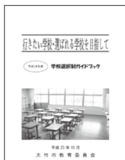
学校選択のガイドブック