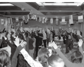
韓国のサムルノリの演奏に合わせて、みんなの気持ちが一っに。国際交流のタベは、大竹国際交流協会が2年に1回行っているビッグイベントです。

社会健康課 ☎2140 10月1日から、水痘および成人用肺炎球菌ワクチンが定期予防接種化されます。対象者、接種方法などは市ホームページ・フェイスブックをご覧ください。 なお、接種費用や助成金額は現在未定ですが、8月中旬に決定し、市広報・ホームページ・フェイスブックなどでお知らせする予定です。