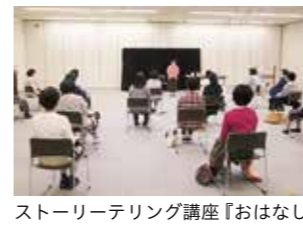
ストーリーテリング講座『おはなしの世界へ』の様子