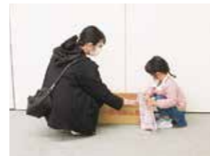
雑誌のリサイクル市開催しました。