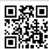
確定申告書等作成コーナーにアクセス

申告書は、e-Tax申告や、自分でパソコンやスマートフォンにより作成または直接記入し、郵送することもできます。3密(密閉・密集・密接)と申告会場の混雑を避ける観点からもぜひ活用してください。