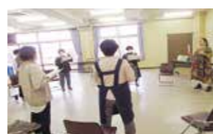
「ゆっくり読もう音読教室」の様子。