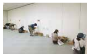
本のリサイクル市の様子。

11月28日 玖波公民館で『KUBAポリスフェスティバル』が開催され、約170人が来場しました。イベントは新庄大竹警察署長の交通安全講話と渡部交通課長のユーモラスな腹話術でスタート。その後、会場内に設置された交通安全体験シミュレーターに挑戦。3面のスクリーンを車が往來する横断歩道横断の疑似体験や反射神経を測る機器に一喜一憂。最後は県警音楽隊の演奏が会場に響き渡りました。