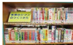
ティーンズコーナー常設展示 「未来のジブンのつくりかた」