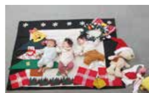
クリスマスフォトスポット 今話題の寝相アートのクリスマスバージョンを作りました。