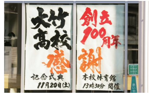
書道部の筆による100周年を告知するポスター。市内の各施設や店舗に貼りだされている。

校歌 青垣の山 色溶けて 小瀬川清く 注ぐ辺に 朝夕や若人の 学び舎は 道にいそしむ 並び立つ 大竹高校 吾等が母校 朝もや煙る 瀬戸内の いつきしま山 聖り嶺に 希みをたぐえ いや高く 集う若人 同胞は 心も浄く 明らかし 大竹高校 吾等が母校 真澄の空に 若竹の 伸びゆく姿 さながらに 直くも正し たくましく 互いに睦ぶ 友垣は いざや進まん 光栄の道 大竹高校 吾等が母校