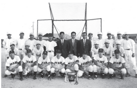
昭和34年初優勝を飾ったチーム。後列左から5人目が監督時代の清永さん。

「市内には4、5千人の卒業生がいます。大竹高校が魅力ある学校となるように頑張ってほしい」。そう先輩からのエールが送られた。