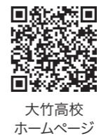
大竹高校 ホームページ

「先ほど、課題という言葉がありました。素行に問題があった時代の影響でしょうか。実際、登下校のときの態度が良くなかったときもあった