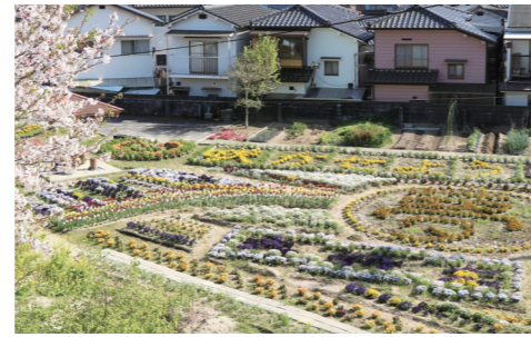
色とりどりの花を咲かせる『クラインガルテン』。平成14年に開園。生徒たちの世話で、『全国花いっぱいコンクール』で、数度の表彰も受けた。