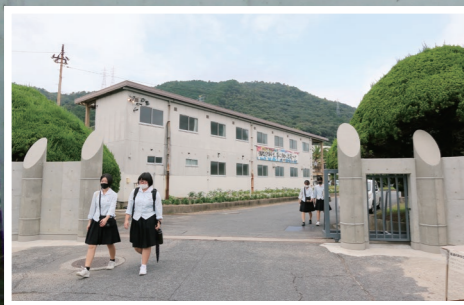
100周年記念事業の一つ、高校正門が改築された。竹をモチーフにした門柱が目目をひく。