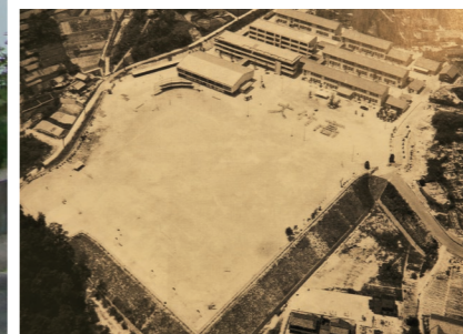
(右) 東栄地区にあった旧海軍海兵団の兵舎を譲り受けた校舎。セーラー服姿の女生徒の姿も見える。(左) 昭和37年、現在地に移転したころ。