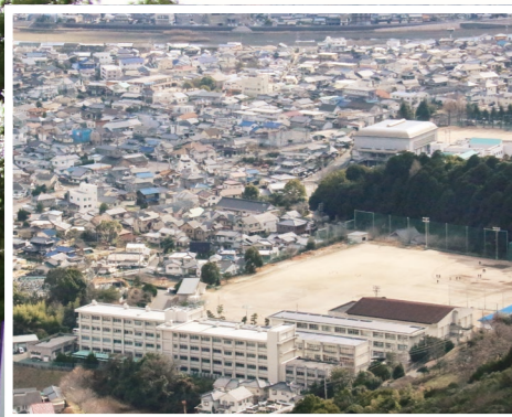
大河原山から望む現在の高校。小高い丘に広がる校舎と運動場。