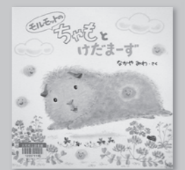
「モルモットのちやもとけだまーず」 なかや みわ/さく (金の星社)