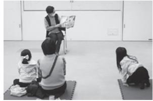
「おはなし会」の様子。