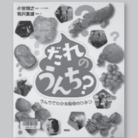
「だれのうち?」 うんちでわかる動物のひみつ? 有沢 重雄/構成・文 小宮 輝之/監修・うんち写真 (信成社)