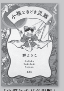
「小福ときどき災難」 群 ようこ/著 (集英社)