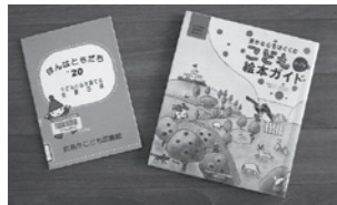
おすすめ絵本ガイド