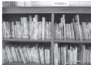
児童図書コーナー