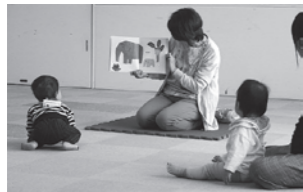
「おひざにだっこのおはなし会」の様子。仲良く絵本の読み聞かせを聞きました。